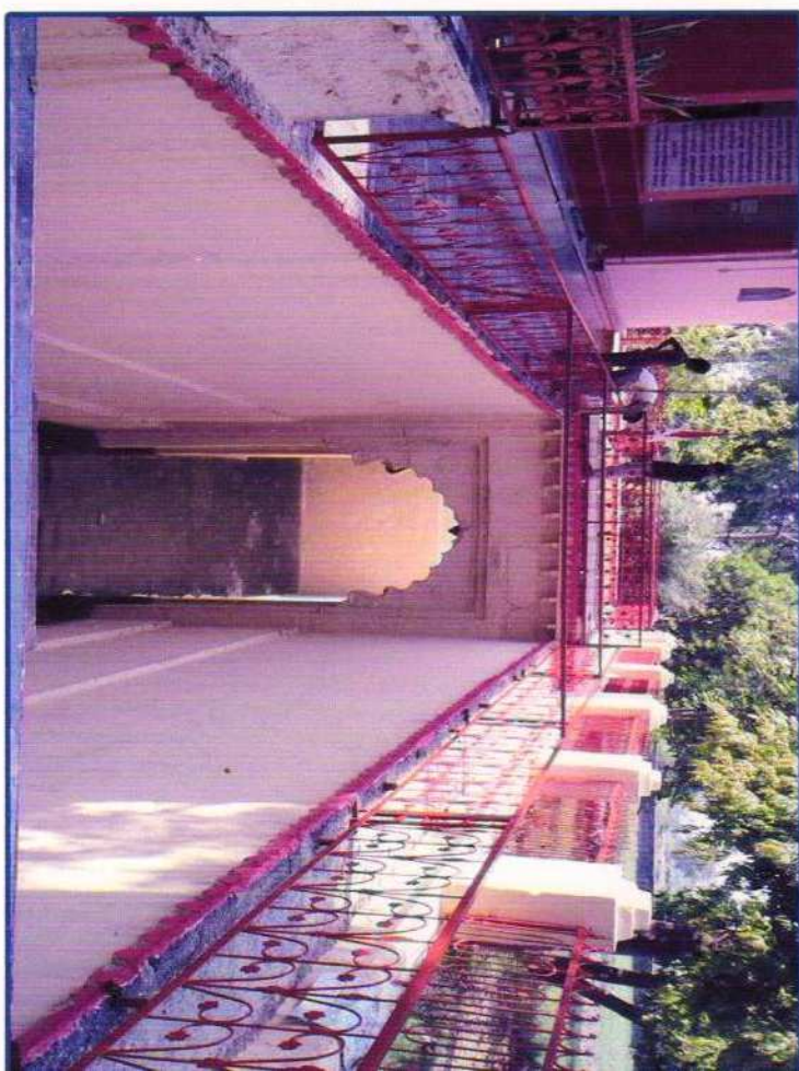
निर्माण के बाद