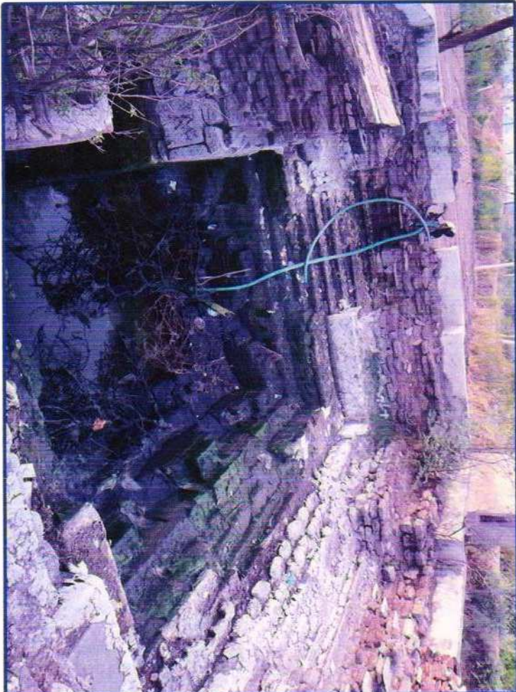
निर्माण से पूर्व