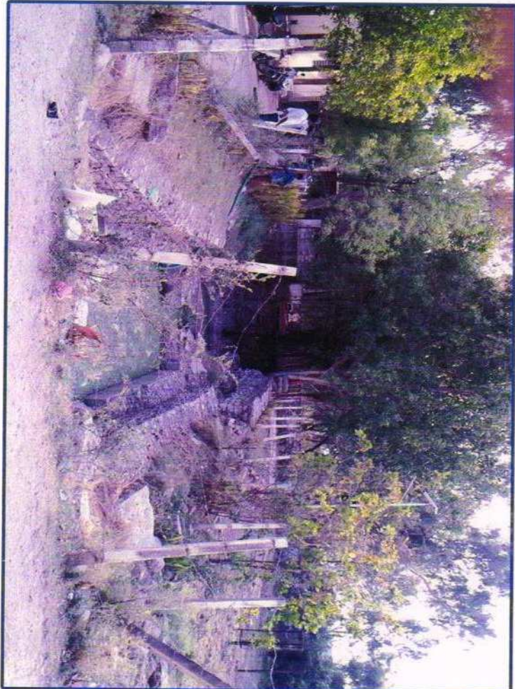
ऑलललरुड डुरु डूरुव