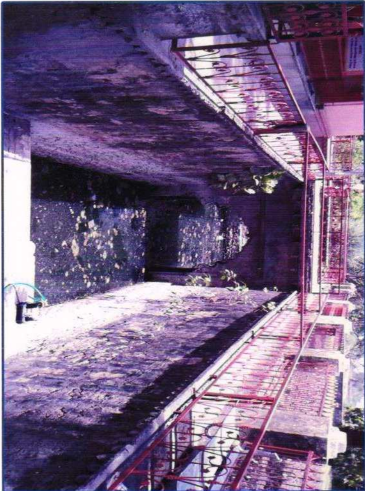
निर्माण से पूर्व