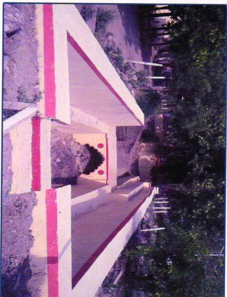
ऑलललरुड कुरु डलरुद